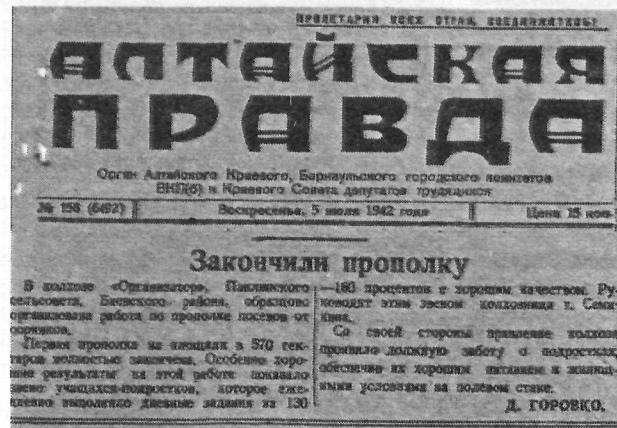
Заметка Д.Горовко «Закончили прополку», опубликованная в газете «Алтайская правда» 5 июля 1942 г.