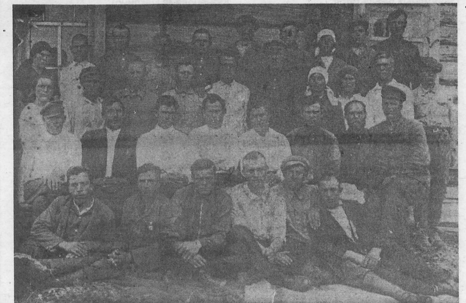
Участники совещания дорожных мастеров Баевского дорожного отдела. 1934 г.