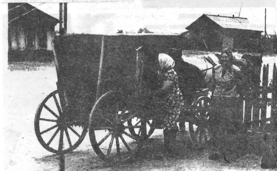
Доставка хлеба на повозке, с.Нижнепайва, начало 1950-х