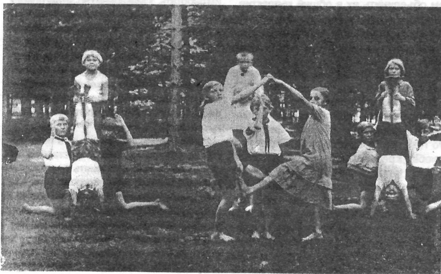
Дети, отдыхающие в Баевском детском лагере, выполняют физкультурные номера, 1939 год.

Шестидесятые – семидесятые годы – это время новых, захватывающих открытий, политической стабильности и относительного экономического благополучия в СССР. 1960-е годы стали началом эры пилотируемой космонавтики. 19 июня